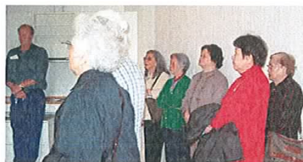
Boligrådgivningen arrangerede studieture for de etniske grupper. Her er en gruppe kinesiske ældre på besøg på et plejehjem