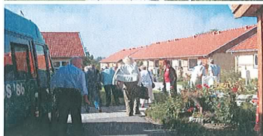
Hå Seniorråd modtages i seniorbofællesskabet Gadekæret i Høje Taastrup.