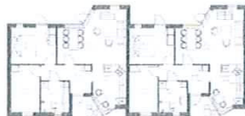
3 rums boliger 83 m 2

Arbejdsgruppen fra Øster Assels står her foran de utidsvarende ældreboliger, der skal give plads til de moderne seniorboliger, der ses til højre